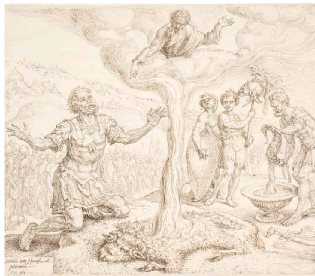
Maarten Van Heemskerck, Gedeone in preghiera, 1561, Windsor Castle, Royal Library

«Se stai per salvare Israele per mia mano, metterò un vello sull'aia: se ci sarà rugiada solo sul vello e tutto il terreno resterà asciutto, io saprò che tu salverai Israele, come hai detto».