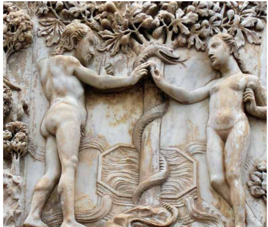
Lorenzo Maitani, Adamo ed Eva, 1310-1330, Orvieto, Duomo

Il serpente era il più astuto di tutti gli animali selvatici che Dio aveva fatto, e disse alla donna: «È vero che Dio ha detto: "Non dovete mangiare di alcun albero del giardino?"».