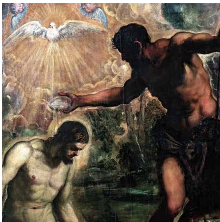
Tintoretto, Battesimo di Cristo, 1580, Venezia, Chiesa di San Silvestro

Gesù uscì dall'acqua: ed ecco, si aprirono i cieli ed egli vide lo Spirito di Dio discendere come una colomba. Ed ecco una voce dal cielo: «Questi è il Figlio mio, amato: in lui ho posto il mio compiacimento».