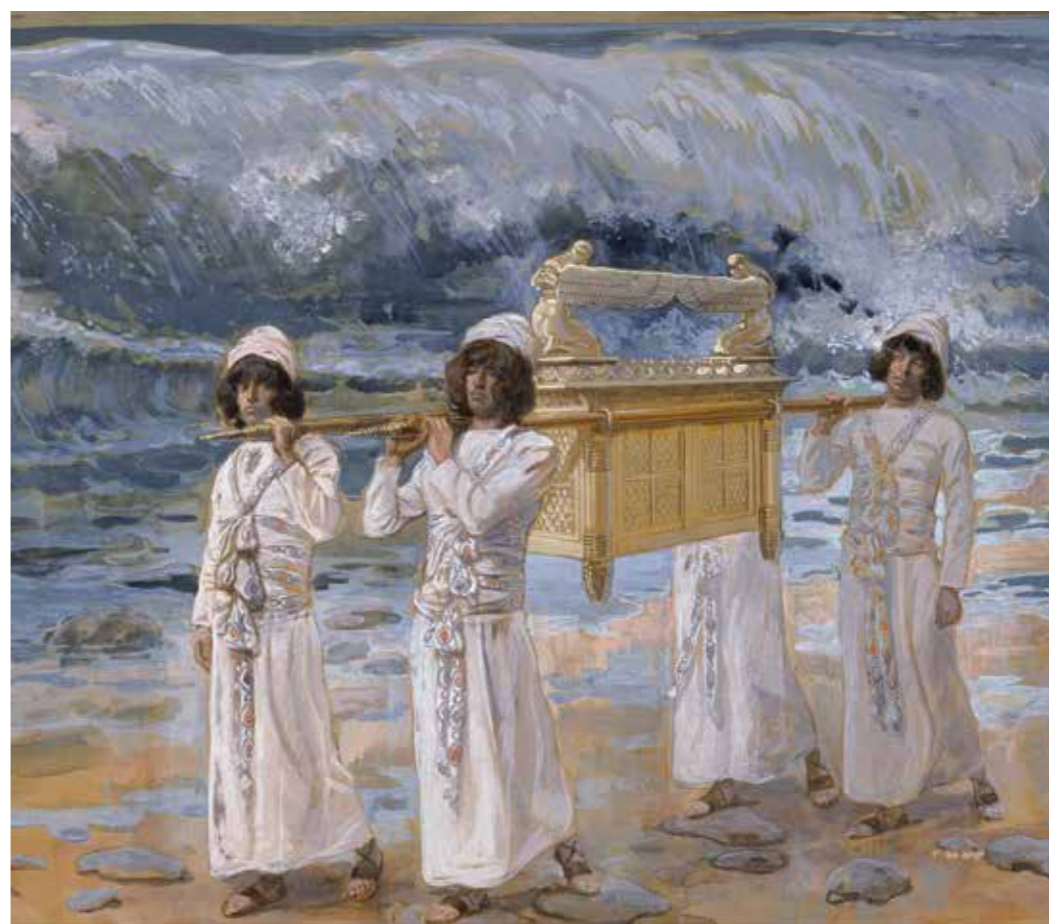
James Tissot, L'Arca passa il Giordano, 1896-1902, New York, Museo Ebraico

Il popolo dunque si affrettò ad attraversare il fiume. Quando poi tutto il popolo ebbe terminato la traversata, anche l'Arca del Signore attraversò, e i sacerdoti si posero dinanzi al popolo.