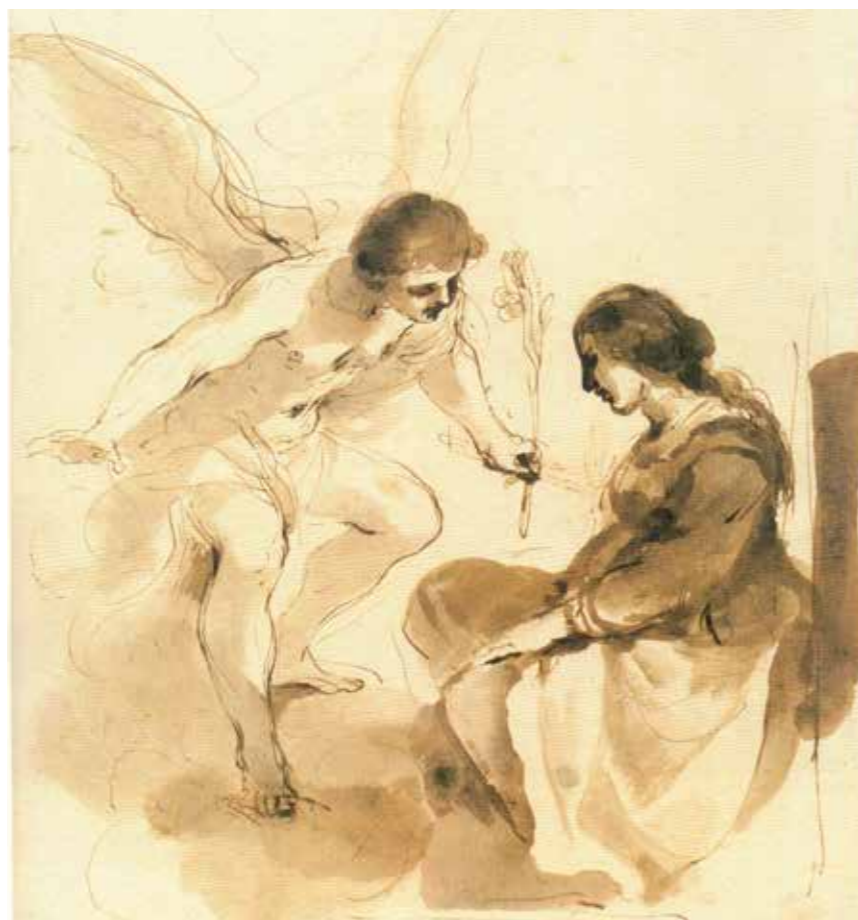
Guercino, Annunciazione, 1616-1618, Windsor Castel, Royal Library

L'angelo le disse: «Non temere, Maria, perché hai trovato grazia presso Dio. Ecco, concepirai un figlio, lo darai alla luce e lo chiamerai Gesù».