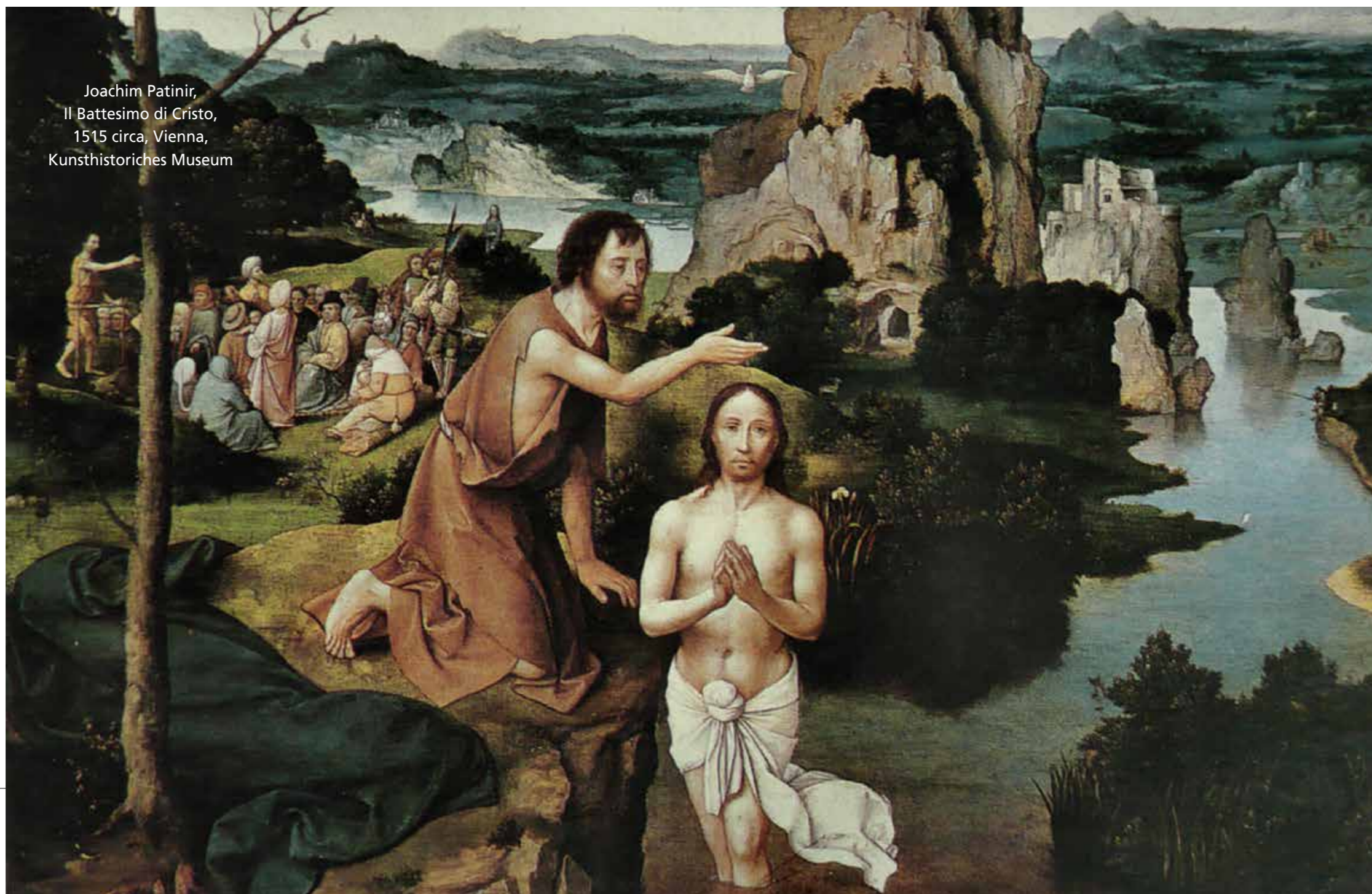
Joachim Patinir, Il Battesimo di Cristo, 1515 circa, Vienna, Kunsthistorisches Museum

Non credere d'aver frutti buoni se rimani un albero cattivo. Cambia il cuore e si cambierà l'opera. Estirpa dal cuore l'avidità e piantaci la carità. (Agostino d'Ippona)