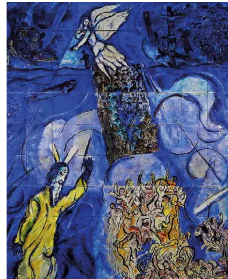
Marc Chagall, Passaggio del Mar Rosso, Nizza, Museo Nazionale Messaggio Biblico

Mosè stese la mano sul mare. E il Signore durante tutta la notte risospinse il mare con un forte vento d'Oriente, rendendolo asciutto. Le acque si divisero. Gli Israeliti entrarono nel mare sull'asciutto.